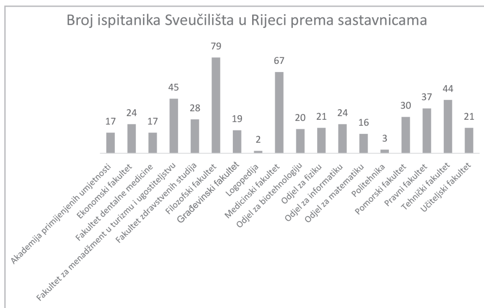
Slika 1. Broj ispitanika Sveučilišta u Rijeci prema sastavnicama Sveučilišta

Ispitanici zaposleni na Sveučilištu u Rijeci mogli su izabrati sastavnicu na kojoj rade. Rezultati su prikazani na slici 1.