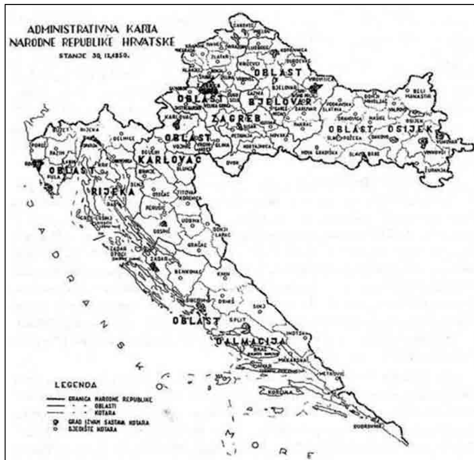
Sl. 1. Upravno-teritorijalna podjela NR Hrvatske na oblasti i kotare 30. rujna 1950. S. ŽULJIĆ, 2001, 6

Izvršni odbori (IO) su upravni i izvršni organi NO-a, ukoliko ti poslovi nisu zakonima i propisima stavljeni u isključivu nadležnost NO-a. Odgovorni su NO-u (čl. 55.). Izvršavaju akte svog NO-a, kao i viših tijela državne uprave te radi toga donose naredbe (čl. 58). U sastavu IO mogu se osnivati "komisije" za izvršenje "poslova i mjera na području privrede i uprave". Članovi komisije mogu biti odbornici i drugi građani (čl. 67.). Savjet građana može se utemeljiti radi "uspješnog izvršenja općih i lokalnih zadataka iz područja pojedinih grana državne uprave". Na čelu savjeta građana je član NO-a (čl. 69.).